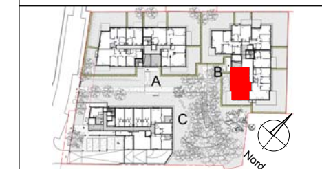
Tableau de surfaces et annexes