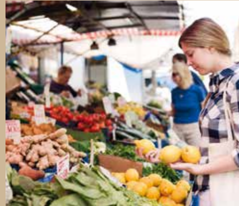
▼ Marché sur l'avenue Henri Barbusse