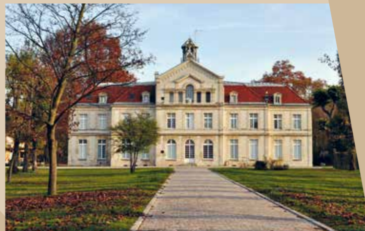
▲ Château de Ladoucette et son parc

Le centre-ville, la Mairie et le fameux Château de Ladoucette sont facilement accessibles à pied. On y découvre le charmant parc de 5,5 hectares de verdure qui séduit petits et grands avec sa ferme pédagogique, son bassin et son parcours santé.