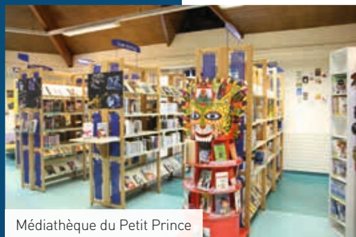
Médiathèque du Petit Prince