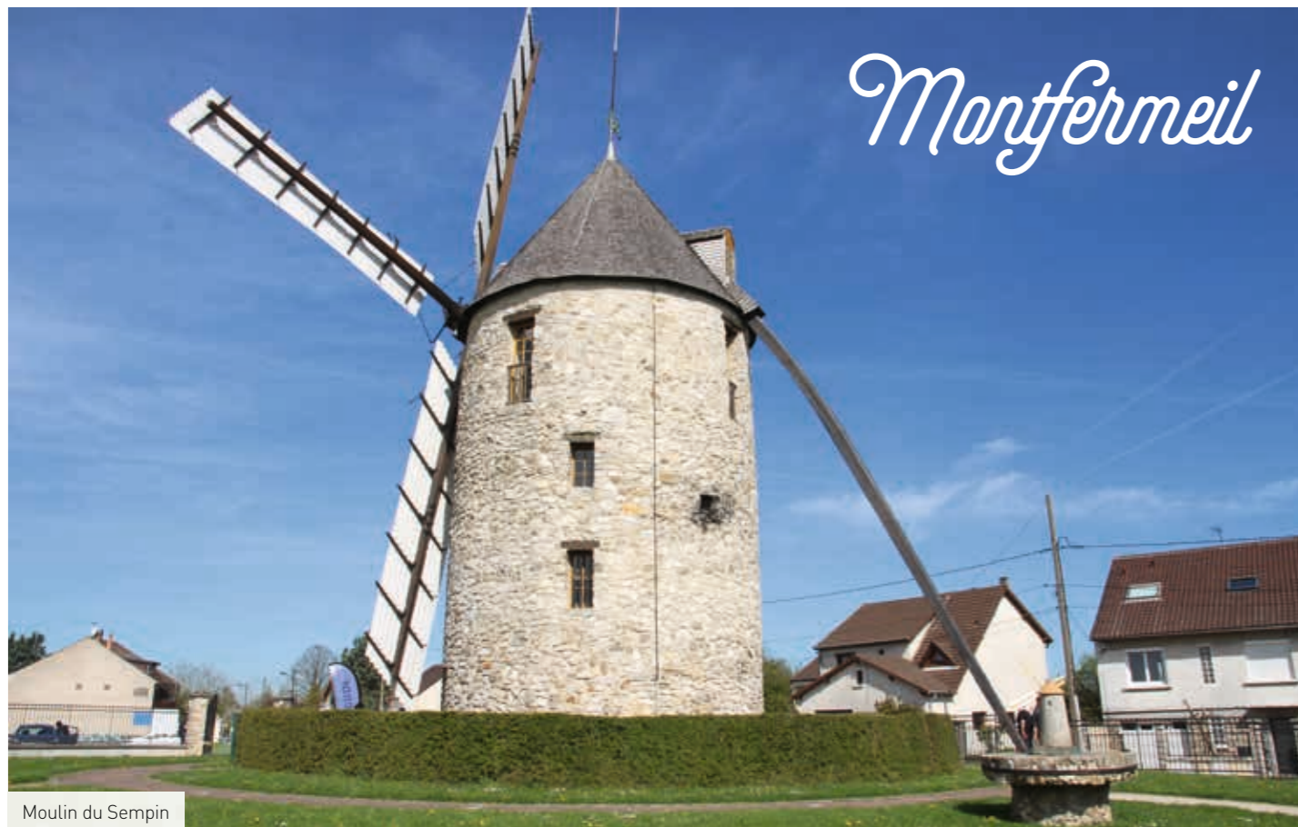
Moulin du Sempin