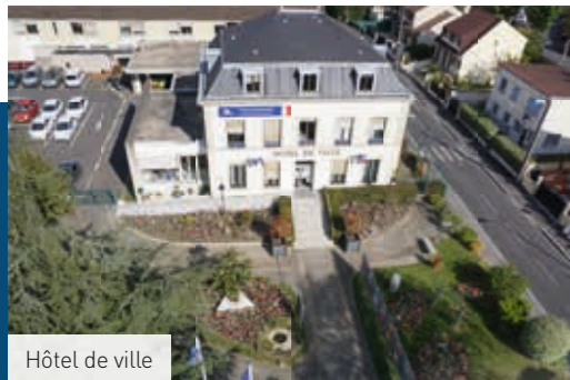
Hôtel de ville